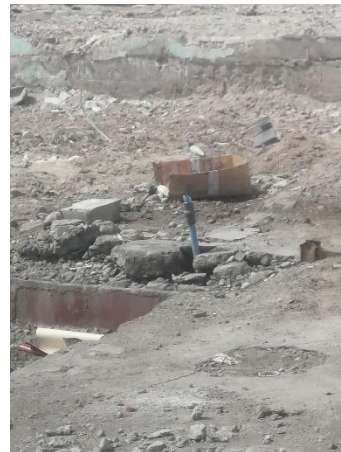
Figura 4. Arranque de agua potable con su respectiva llave, ubicado en Manzana J, acceso por Pasaje Cocharcas.