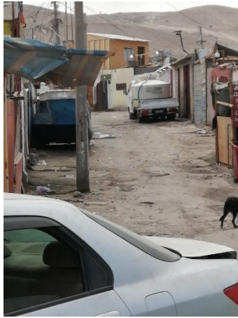
Figura 1. Se observa camión con estanque cargando agua desde domicilio de Calle Ladislao Córdova #1779.