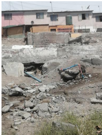
Figura 3. Arranque de agua potable con su respectiva llave, ubicado en Manzana J, acceso por Av. Capitán Avalos.