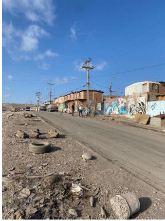
Figura 5. Habitantes realizando intervención en sistema de alcantarillado, Av. Morrillos.