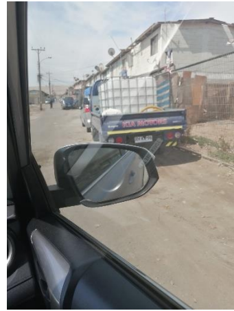
Figura 2. Se observa camión con “bin” estacionado fuera de domicilio de Pasaje Cocharcas #1781, a un costado de la Sede Social del sector.