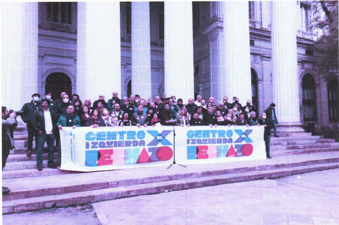
Movimientos lanzan plataforma “Centroizquierda por el Rechazo”