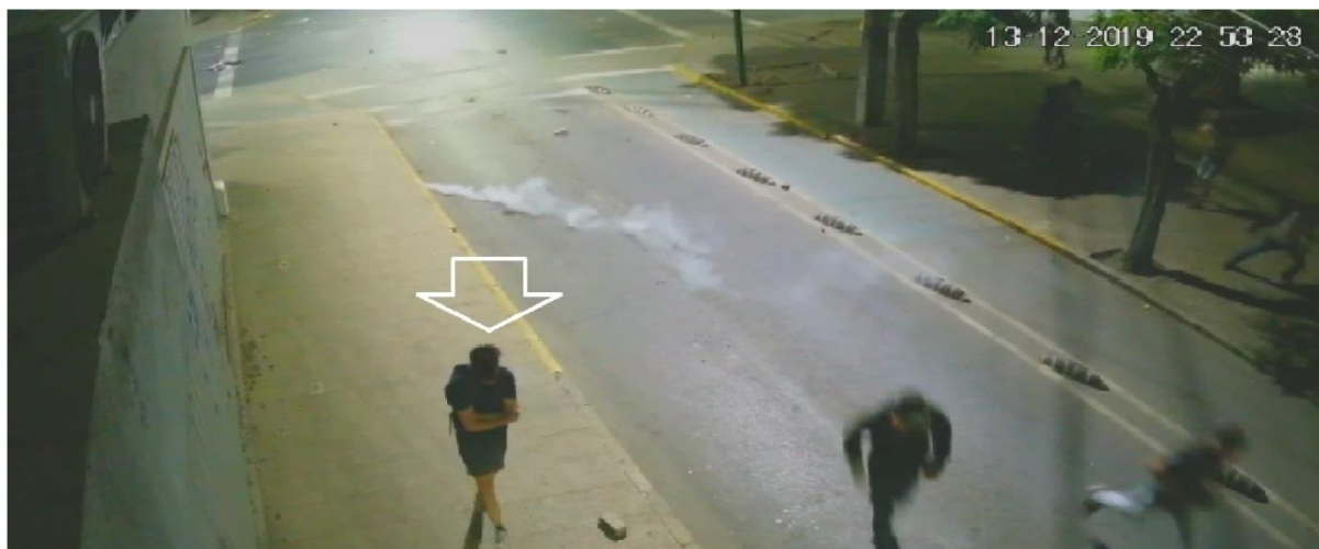
Figura N° 29.- Captura de imagen de grabación de cámara de video vigilancia N° 12, de fecha 13.DIC.019, 22:53:28 horas. Flecha muestra a víctima.