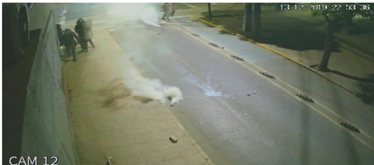
Figura N° 36.- Captura de imagen de grabación de cámara de video vigilancia N° 12, de fecha 13.DIC.019, 22:53:36 horas. Se observa al funcionario que efectuó el disparo, caminar en dirección Sur.