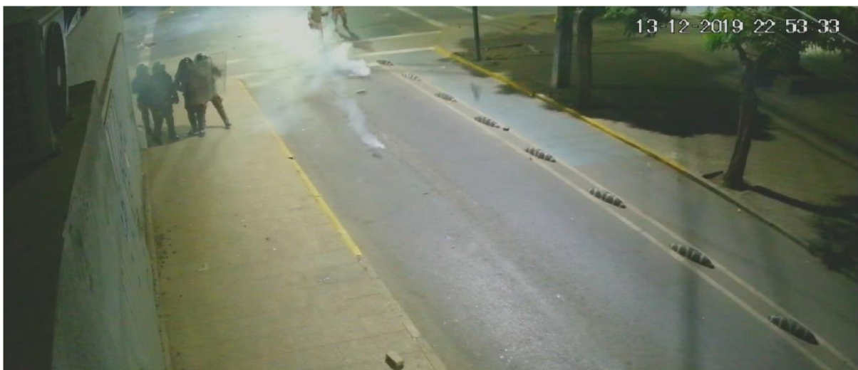
Figura N° 35.- Captura de imagen de grabación de cámara de video vigilancia N° 12, de fecha 13.DIC.019, 22:53:33 horas. Se observa llegar un cuarto funcionario.