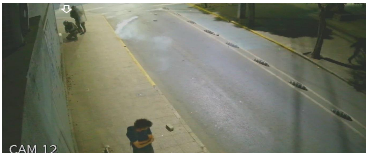
Figura N° 31.- Captura de imagen de grabación de cámara de video vigilancia N° 12, de fecha 13.DIC.019, 22:53:30 horas. Flecha muestra a funcionario en posición de disparo apuntando a la víctima, junto al cual se observa un segundo funcionario portando un escudo.