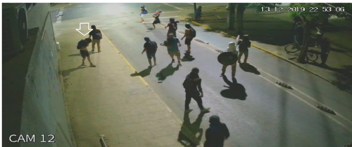
Figura N° 26.- Captura de imagen de grabación de cámara de video vigilancia N° 12, de fecha 13.DIC.019, 22:53:06 horas. Flecha muestra a víctima.