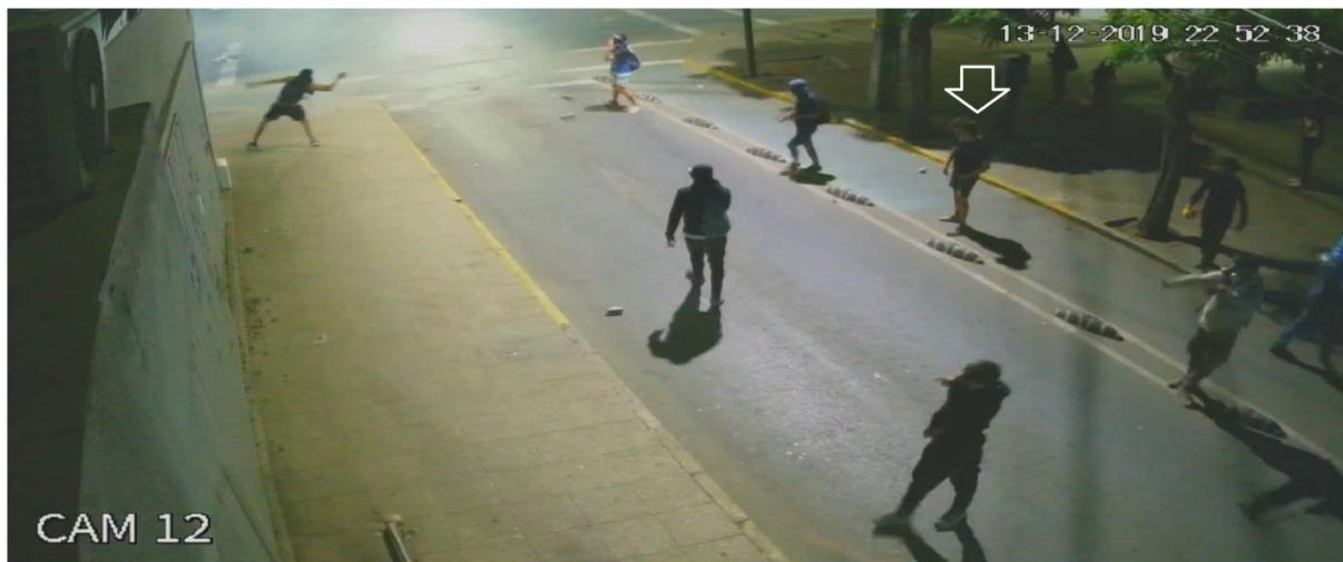
Figura N° 25.- Captura de imagen de grabación de cámara de video vigilancia N° 12, de fecha 13.DIC.019, 22:52:38 horas. Flecha muestra a víctima.