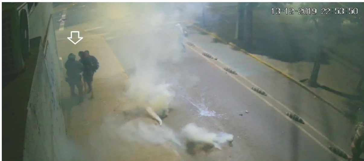
Figura N° 39.- Captura de imagen de grabación de cámara de video vigilancia N° 12, de fecha 13.DIC.019, 22:53:50 horas. Se observa a funcionario entregar a la