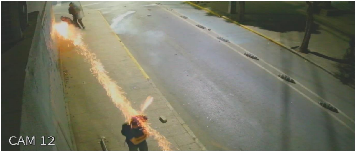
Figura N° 32.- Captura de imagen de grabación de cámara de video vigilancia N° 12, de fecha 13.DIC.019, 22:53:30 horas. Se observa ráfaga impactando a individuo por la espalda.