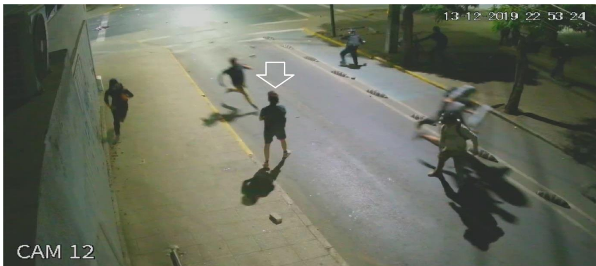
Figura N° 28.- Captura de imagen de grabación de cámara de video vigilancia N° 12, de fecha 13.DIC.019, 22:53:24 horas. Flecha muestra a víctima.