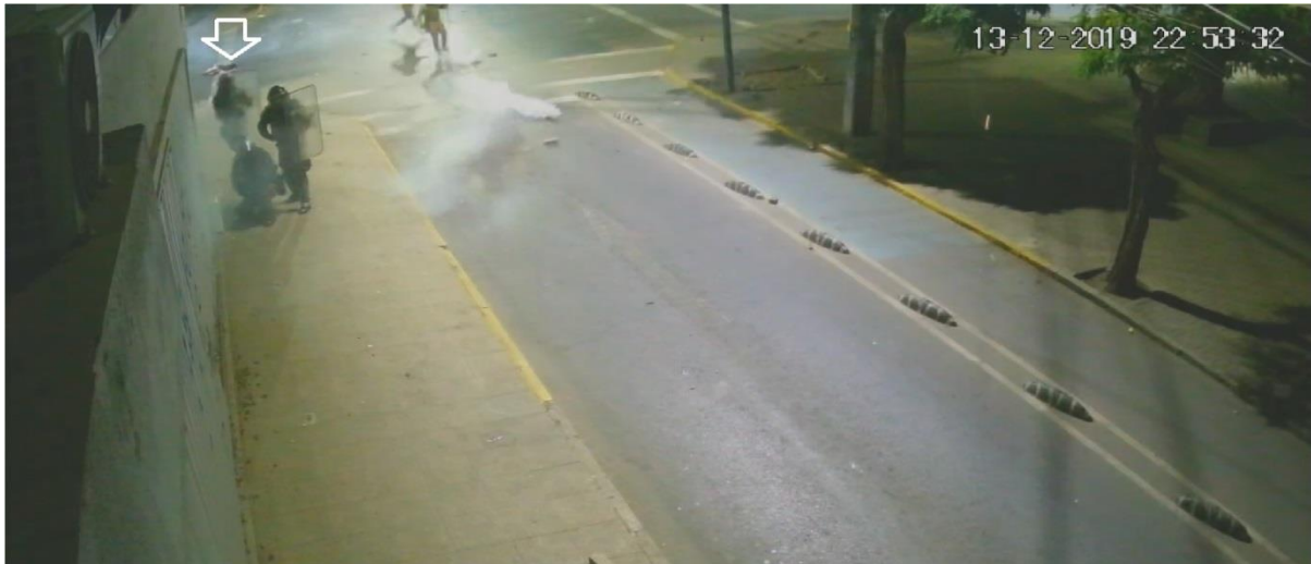
Figura N° 34.- Captura de imagen de grabación de cámara de video vigilancia N° 12, de fecha 13.DIC.019, 22:53:32 horas. Se observa llegar un tercer funcionario.