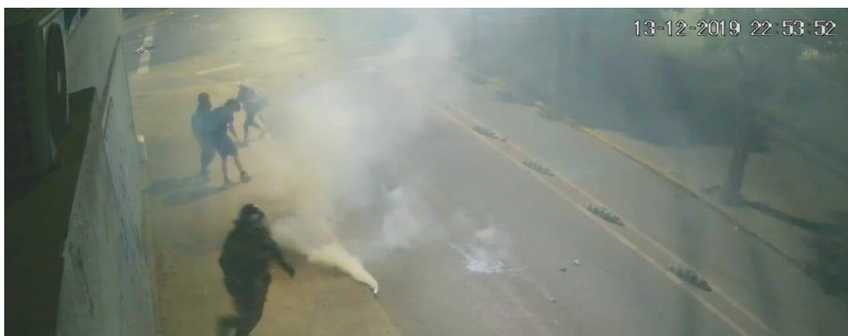
Figura N° 40.- Captura de imagen de grabación de cámara de video vigilancia N° 12, de fecha 13.DIC.019, 22:53:52 horas. Se observa víctima junto a civiles y al funcionario correr en dirección Norte.