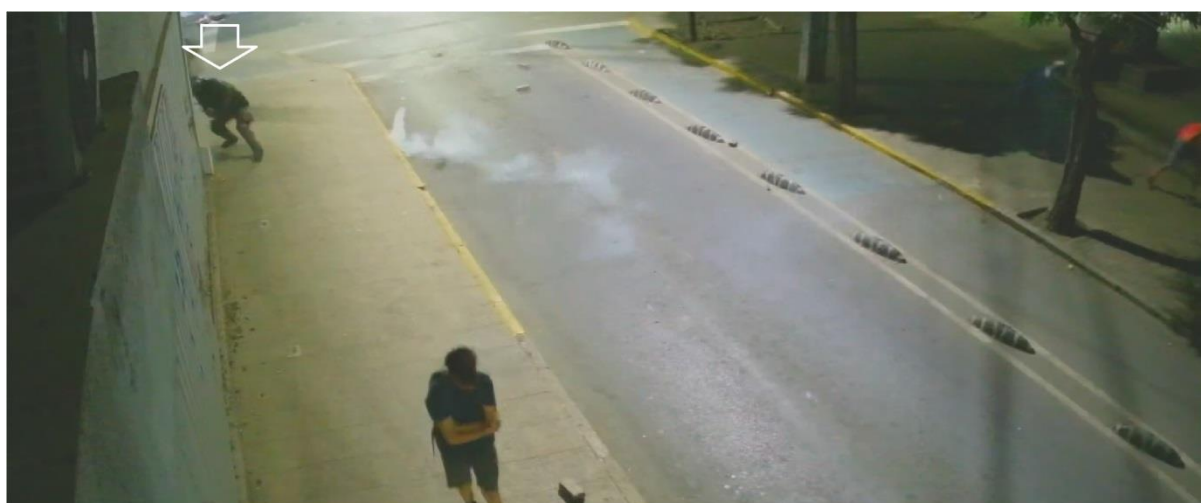
Figura N° 30.- Captura de imagen de grabación de cámara de video vigilancia N° 12, de fecha 13.DIC.019, 22:53:29 horas. Flecha muestra a funcionario deteniéndose en vereda Poniente de la intersección.