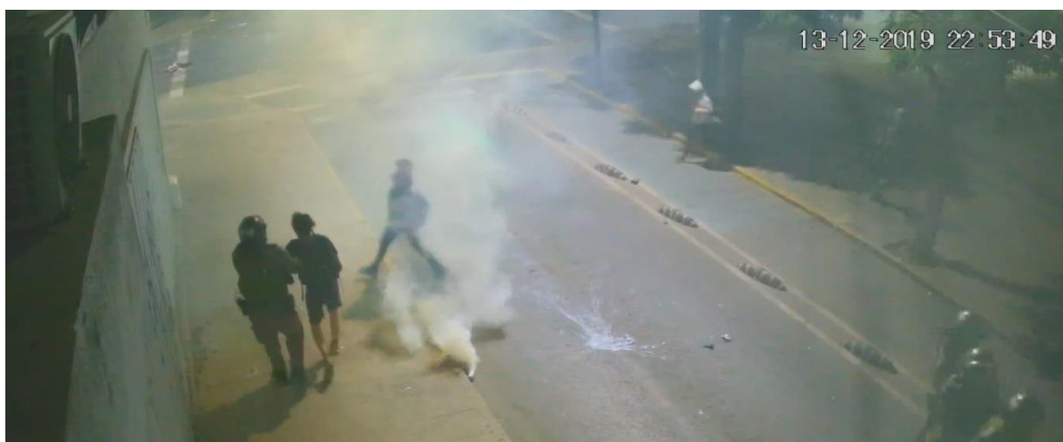
Figura N° 38.- Captura de imagen de grabación de cámara de video vigilancia N° 12, de fecha 13.DIC.019, 22:53:49 horas. Se observa a civil acercarse a