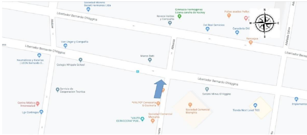
Figura N° 41.- Flecha indica la ubicación y dirección de la cámara N° 12.-