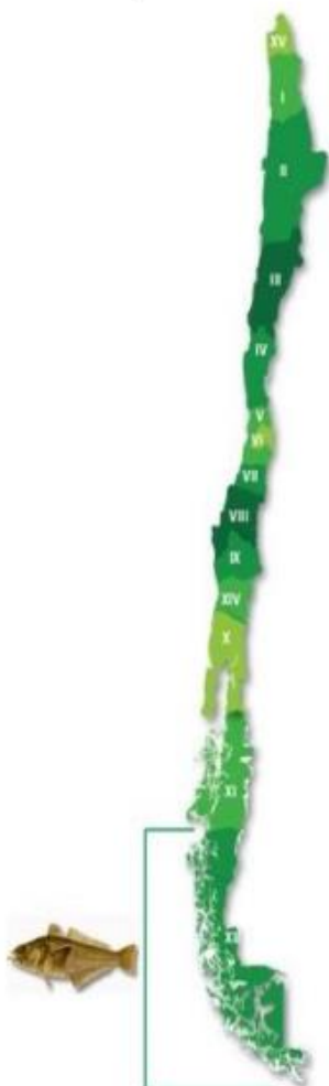
Figura 1. Unidad de Pesquería licitada de Bacalao de profundidad Dissostichus eleginoides .